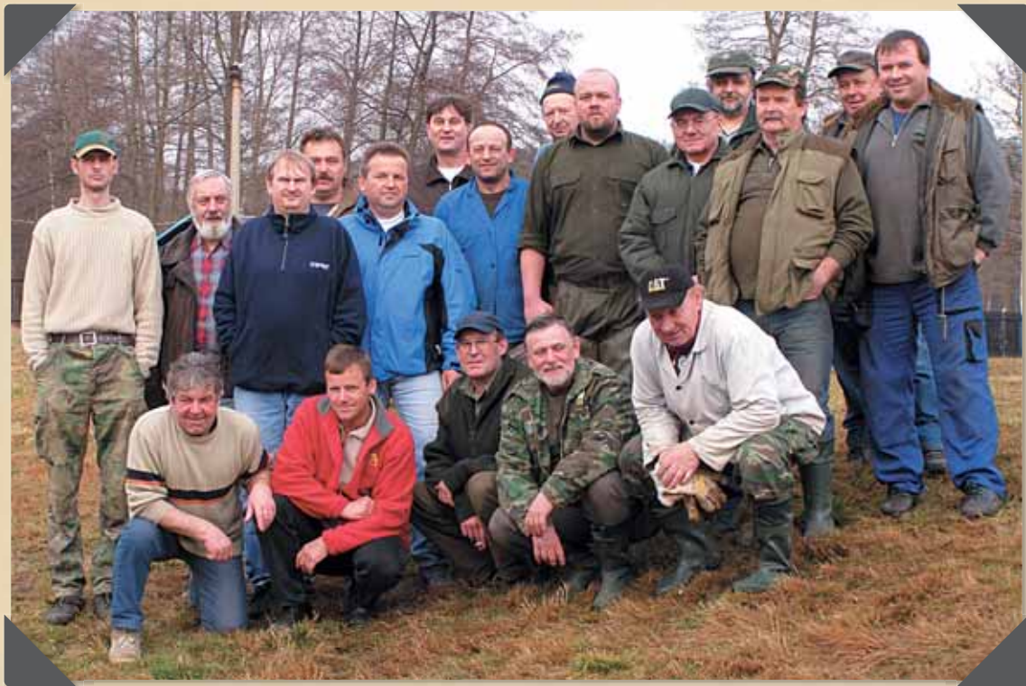
Fotografie členů výboru a hospodářského sboru ČRS MO Božičany pořízená v den 50. výročí založení MO – 15. 3. 2009.